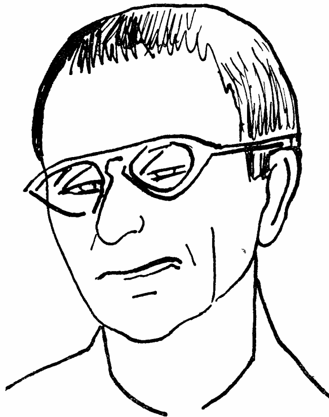
BERTOLT BRECHT (dibujo de S. O. Sabsay)